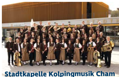
Stadtkapelle Kolpingmusik Cham